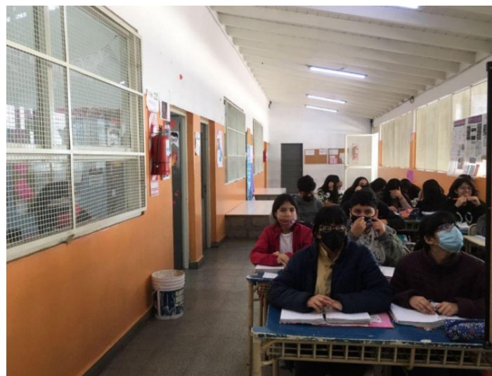
Clases en el pasillo

Nota. Archivo fotográfico de Candela Ciongo Fernández, junio del 2022.