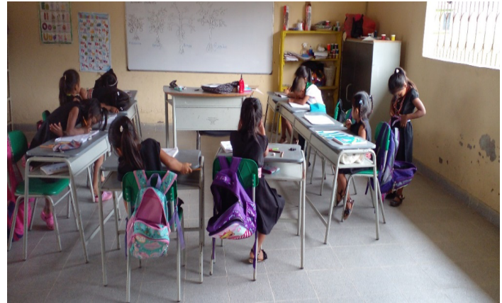
Estudiantes de grado segundo tomando apuntes

Se finalizó con la pregunta: ¿cuenta en casa con espacios propicios para que su hijo realice las tareas escolares? Los padres de familia establecieron que sus hijos hacen las tareas en el comedor; ahí los niños se sientan de manera adecuada y cuentan con un espacio iluminado para su comodidad. De igual forma, se logró observar que los estudiantes mejoraron su actitud y disposición en clase para el desarrollo de las actividades planteadas durante la jornada escolar. Esto permitió que los niños adquirieran un hábito de estudio adecuado para desempeñar las labores escolares, ya que ellos buscan lugares cómodos, adecuados e iluminados para la realización de sus tareas y trabajos académicos.