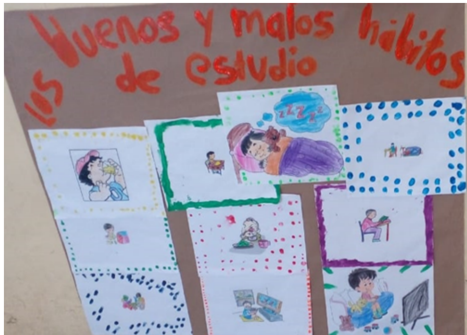
Actividades de identificación de hábitos de estudio

De igual forma, el vínculo de la escuela con su entorno debe impregnar todas las actividades institucionales y abarcar a todos los actores de la comunidad educativa. Cada uno está ligado al contexto por la actividad única que realiza, la cual está determinada por su aporte al quehacer institucional específico. Las formas tangibles de los muchos participantes en la interacción comunitaria dan forma al estilo institucional de esa relación.