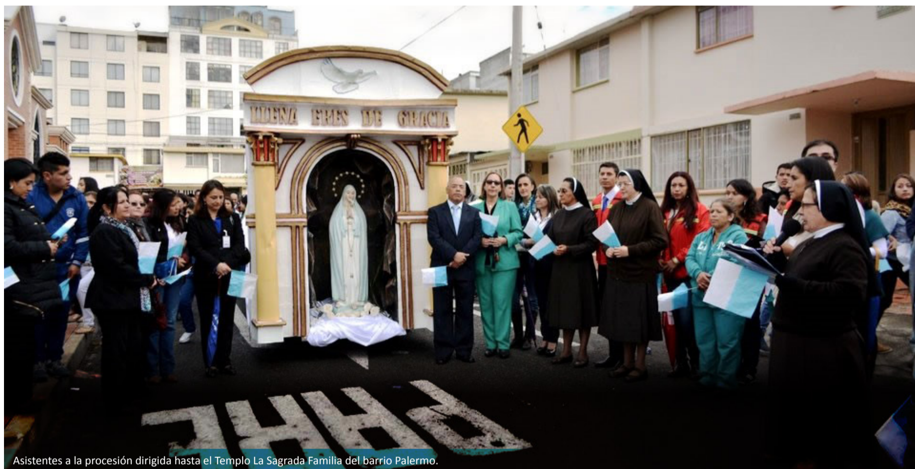
Asistentes a la procesión dirigida hasta el Templo La Sagrada Familia del barrio Palermo.

Yamile Adriana López Rodríguez Unidad de Radio y Televisión Universidad Mariana