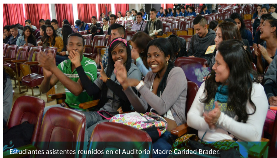
Estudiantes asistentes reunidos en el Auditorio Madre Caridad Brader.

Por ello, se hace un especial agradecimiento a Pastoral Universitaria como principal responsable de la organización de la actividad, así como también a los docentes del Departamento de Humanidades, y en general a todas las dependencias que colaboraron activamente para cumplir con este encuentro mariano.