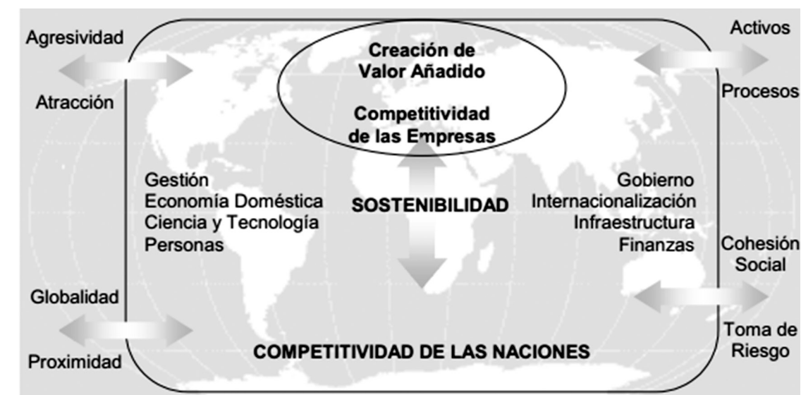
Figura 3. El Cubo Competitivo del IMD.

En términos generales, los modelos Diamante de Porter e IMD tienen características esenciales comunes que favorecen la concepción de la competitividad como problemática pública, en tanto se requiere la consolidación de factores institucionales que incentiven la consolidación de las empresas. Pese a ello, el modelo IMD es el que mayores aplicaciones ha tenido en términos empíricos y medición de la competitividad. En adelante, la presente investigación utilizará las dimensiones propuestas por este modelo para realizar las aplicaciones empíricas de medición de la competitividad.