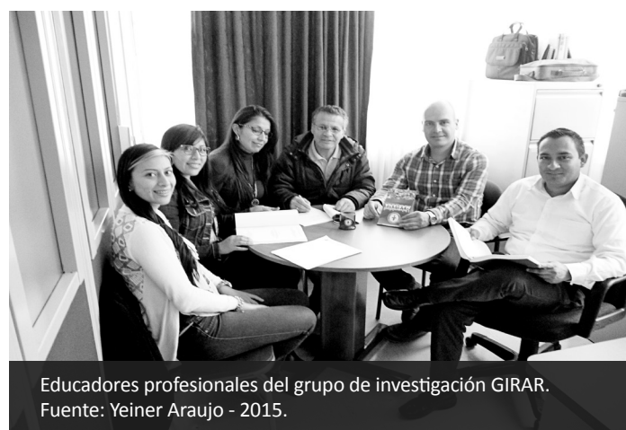
Educadores profesionales del grupo de investigación GIRAR.

Los educadores profesionales del Programa de Tecnología en Radiodiagnóstico y Radioterapia de la Universidad Mariana, además de cumplir la formación en el área profesional de su currículo, continúa con el cumplimiento de otra de las funciones sustantivas de la Universidad, en lo referente con la investigación; por ello, se está consolidando su grupo y línea de investigación, haciendo una aproximación en su elaboración. He aquí unos adelantos significativos en cuanto al plan estratégico se refiere.