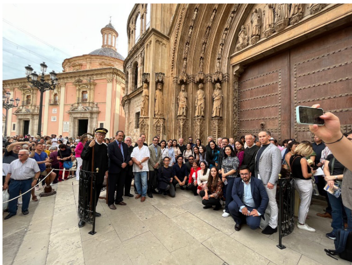
Participantes del VI Coloquio de Investigación de Derecho junto a los jueces del Tribunal de las Aguas