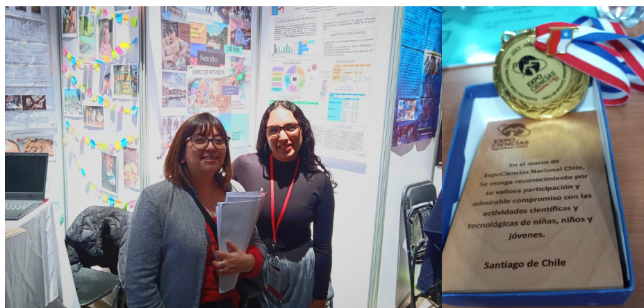
Participantes y reconocimientos

Nota. Registro fotográfico del Encuentro de Semilleros Expo Ciencias Nacional Chile, 2023.