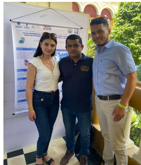
Participantes del encuentro

Nota. Registro fotográfico del XXVI Encuentro Nacional y XX Encuentro Internacional de Semilleros de Investigación RedCOLSI, Cartagena, Colombia, 2023.