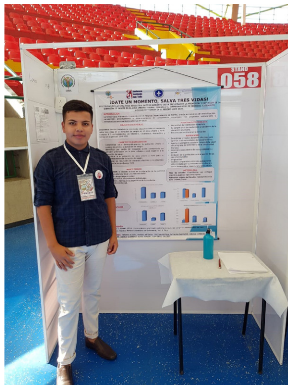
Figura 2. Estudiante Semillero de investigación Alquimistas, Unimar.