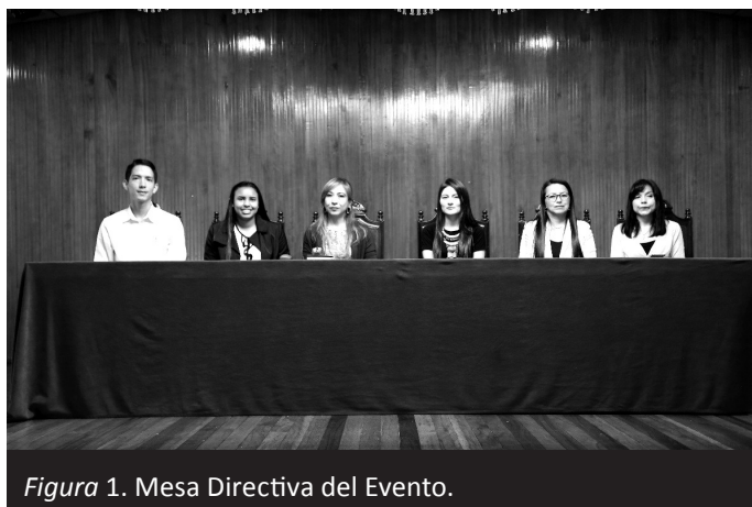
Figura 1. Mesa Directiva del Evento.

Directora Programa de Enfermería Universidad Mariana