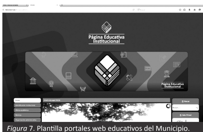
Figura 7. Plantilla portales web educativos del Municipio.