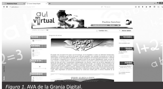
Figura 1. AVA de la Granja Digital.