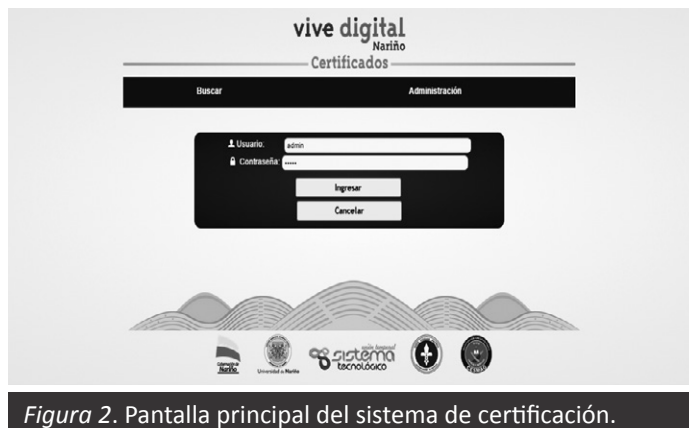
Figura 2. Pantalla principal del sistema de certificación.

A continuación se presenta una pantalla de ingreso al sistema de certificación: