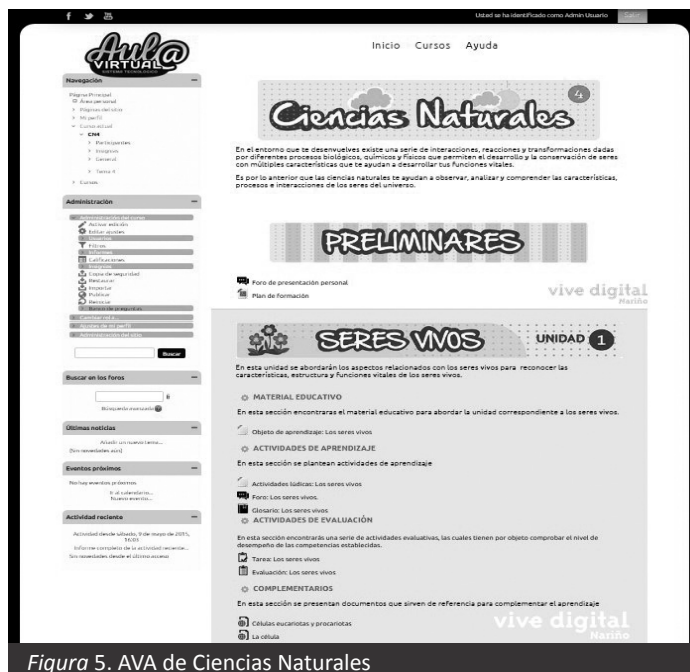
Figura 5. AVA de Ciencias Naturales

Actividad a05-2: Talleres de capacitación en el uso y apropiación de los AVA