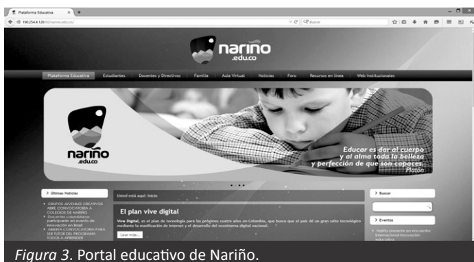
Figura 3. Portal educativo de Nariño.

Actividad a05-1 Implementación de ambientes virtuales de aprendizaje (AVA)